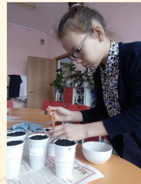
Посев семян различных сортов капусты