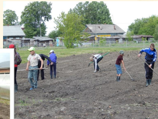
Работа школьников на пришкольном участке